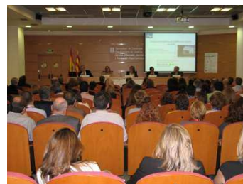
Acto inaugural de las XI Jornadas Catalanas de Actualización en Medicina Forense