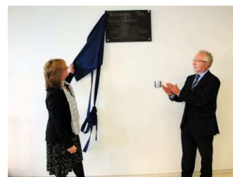
La Consejera de Justicia descubre la placa conmemorativa