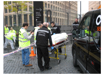
Simulacro en la Ciudad de la Justicia de Barcelona y l'Hospitalet de Llobregat