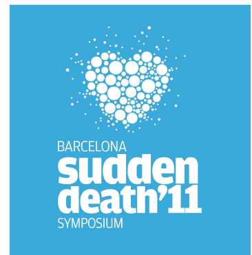
Cartel Simposio sobre muerte s bita